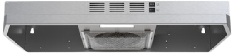
OHF130-SS / OHF124-SS